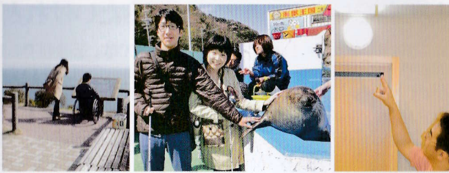
太平洋を望む 鳥羽展望台(鳥羽市)

そんな本人や、ご家族、グループの方のために 伊勢・鳥羽・志摩を中心に三重県内の旅の バリアフリー情報を 無料でご紹介する観光案内センターです