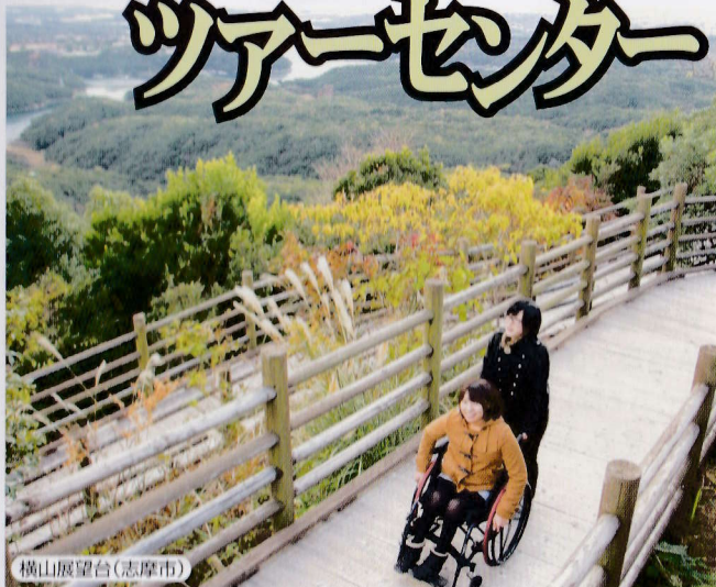
横山展望台(志摩市)

伊勢志摩バリアフリーツアーセンターは、 障がいや高齢で自由がきかなくなってきたけれど 旅行へ行きたい! 温泉に入りたい! 美味しい料理を食べたい!